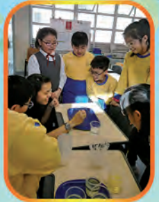
Explaining how to do the experiment

Science, Technology, Reading, Engineering, Arts and Maths. What do all these have in common? When integrated together, they teach students critical thinking and creativity to apply ideas and skills. Our Super Detectives for P.5 students this year learned how to be scientists by using literacy skills and thinking skills in different areas. They learned about the scientific method to do inquiry work before applying everything they have learned in a STREAM Lab. In the STREAM Lab, our students tested which paper weight or texture makes the best airplane applying the skills of research, engineering, conducting a fair test, and analytical skills to explain their results. We hope our students continue their interest in STREAM!