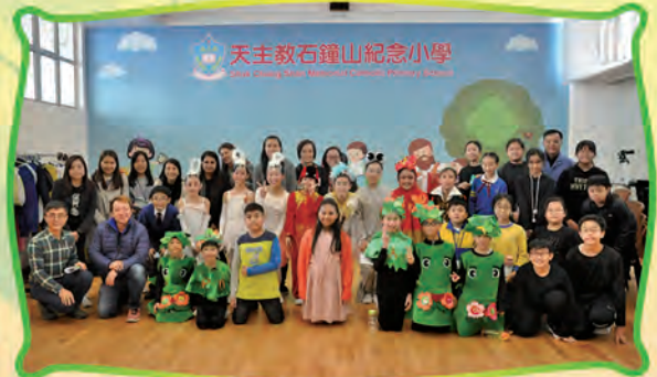
The cast and crew of the English Drama Club.