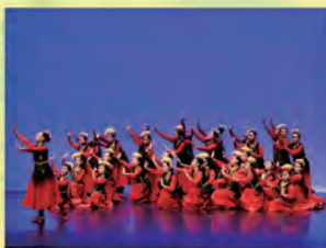
中國舞高級組表演舞蹈《美麗的古麗》