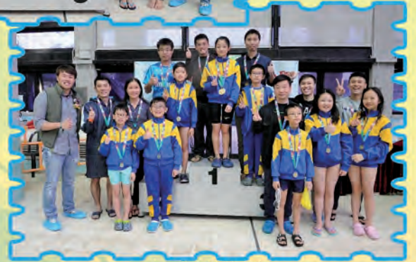
水運會師生接力賽