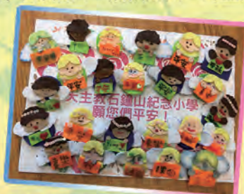
基督小先鋒同學親手製作的小天使，為護養院的長者送上祝福