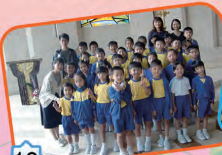
二年級同學參觀聖多默宗徒堂

為了培養學生自主學習及共通能力，本校於去年11月及本年3月進行了戶外學習日。各班級同學分別到郊野公園、博物館及青馬大橋等地進行活動，同學們參觀時都表現雀躍。戶外學習日旨在跳出課室，讓同學在日常周邊環境中體驗、實踐、感受及探究，擴闊課堂以外的學習經歷，增廣見聞，從以內化知識，體現我校「學習有方」(Study Smart) 的核心價值。