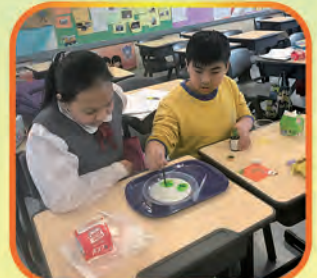
Conducting the experiment