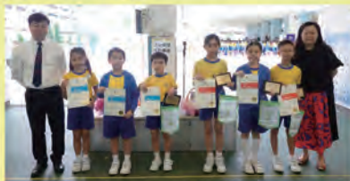
鋼琴獨奏及中樂組別