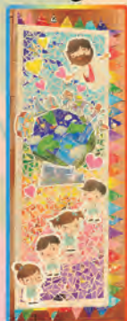
龍舟旗設計比賽冠軍作品

在此要感謝校長及老師們的支持，家長們無私的奉獻，同學們的參與，及所有捐贈禮品給本校的善心人，令籌款活動順利完成。