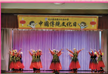
高年級中國舞表演