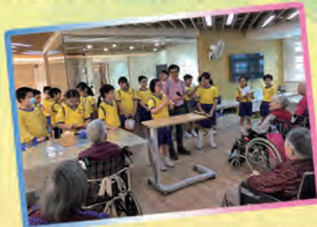
基督小先鋒的同學為護養院的長者表演