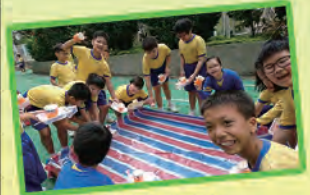
四年級流水動力船