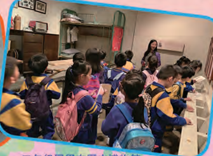
二年級同學在歷史博物館體驗昔日香港