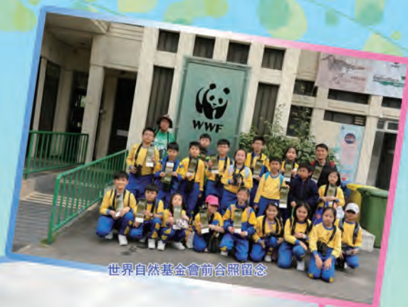
世界自然基金會前合照留念

這次賞鳥活動邀請了香港觀鳥會的導賞員沿途講解，學生們手持鳥類圖鑑，領上掛著雙筒望遠鏡，心裏都抱著對大自然的尊重和欣賞：有的眼明手快地追逐飛鳥的行蹤；有的屏息靜氣遙望遠處悠遊的涉禽。鷓鴣、白頸鴉、琵嘴鴨、黑臉琵鷺、鳳頭潛鴨……除了認識更多鳥名外，藉著了解雀鳥的生活習性、形態、行為等，學生可以從觀察中得到樂趣，親身感受大自然的生機和奧妙，成為關心香港自然生態的一分子，把經驗與其他人分享。