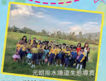
元朗排水繞道生態導賞