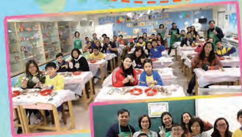
水仙花親子工作坊

活動最後於一片歡樂聲中結束，家長及學生都能把切割好的水仙花頭帶回家。在此特別鳴謝校工及園藝組義工家長們協助教授切割水仙花的技巧。