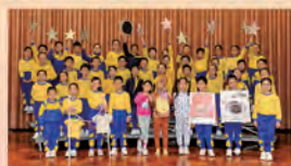
Lower Primary Choral Speaking