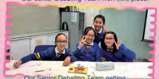
Our Senior Debating Team getting ready for a debating match.