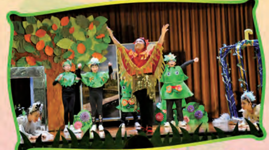
Our students performing in the drama festival.

Our sincere gratitude to parent volunteers and teachers, the costumes and props were made to perfection without which the play would be incomplete.