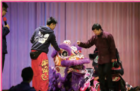
丘校長為醒獅點睛