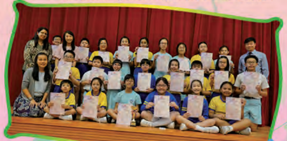
Congratulations on an outstanding performance! We are proud of our students.