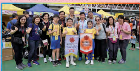
石鐘山小學在比賽中奪得一冠一亞佳績