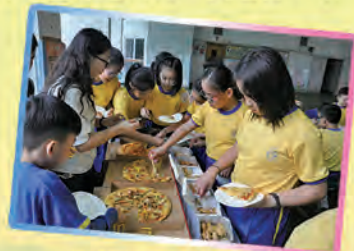
貧富宴中的「富翁」可享用豐富的薄餅餐