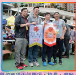
學校獲得兩個獎項，校長、老師、家教會正副主席倍感興奮。