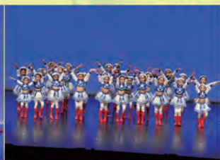
中國舞初級組表演舞蹈《天藍藍》