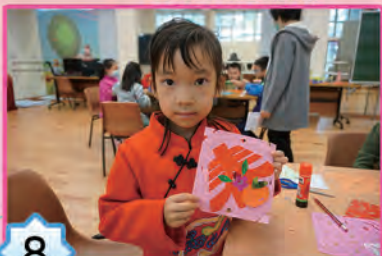
創意剪紙貼畫設計