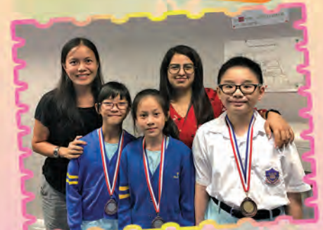
Our Junior Debating Team won third place.