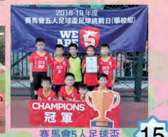
賽馬會五人足球盃足球挑戰日(學校組)冠軍