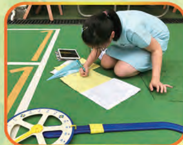
Conducting a fair test with different textured and weighted paper airplanes.