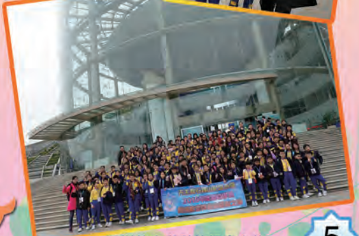
深圳航空與科技探索之旅

本年度常識科進行多元化的活動，有動有靜，包括境外考察、戶外參觀、STEM科技日、水耕菜種植，增潤課程等不同類型活動，讓學生擴闊學習視野、培養科學與科技的探索精神，建立正確的價值觀、珍惜食物和愛護地球。