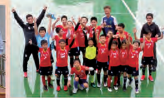
荃灣區校際足球賽亞軍