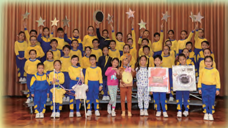
Our lower primary choral team performing with feeling.

Finally, we appreciate all the help from the parent volunteers in making props and costumes so that we could achieve such fantastic results.