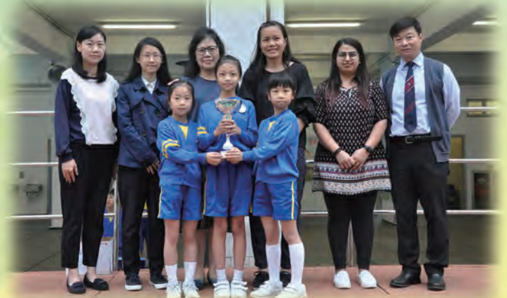
We won first place! Thank you to all the teachers and parents for their help.