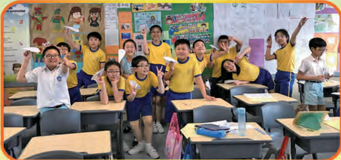
How does the design of a paper airplane affect the four forces of flight? Students testing their paper airplane designs.