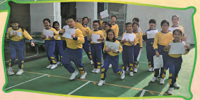
課堂活動：超光速飛行