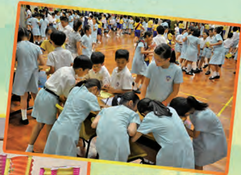
同學自發討論燈謎的答案