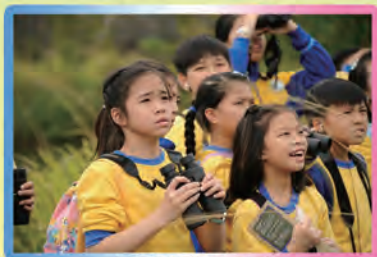
小小觀鳥隊工具齊全