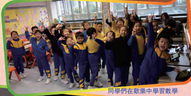
同學們在歡樂中學習數學