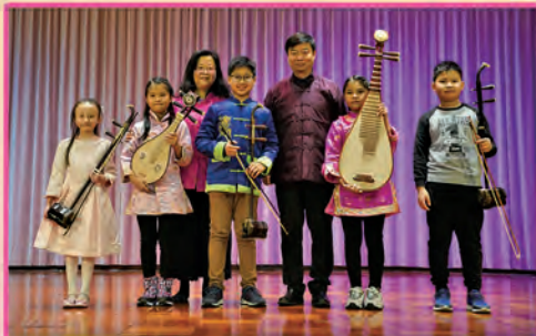
丘校長與中樂表演生合影