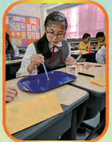
Working together to complete the experiment