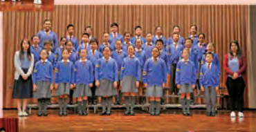
Upper Primary Choral Speaking