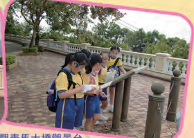
三年級同學參觀青馬大橋觀景台

為了培養學生自主學習及共通能力，本校於去年11月及本年3月進行了戶外學習日。各班級同學分別到郊野公園、博物館及青馬大橋等地進行活動，同學們參觀時都表現雀躍。戶外學習日旨在跳出課室，讓同學在日常周邊環境中體驗、實踐、感受及探究，擴闊課堂以外的學習經歷，增廣見聞，從以內化知識，體現我校「學習有方」(Study Smart) 的核心價值。