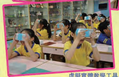
虛擬實體教學工具