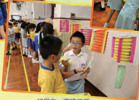
好朋友一齊猜燈謎