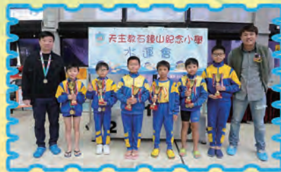
一至六年級男子全場總錦標