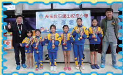
一至六年級女子全場總錦標