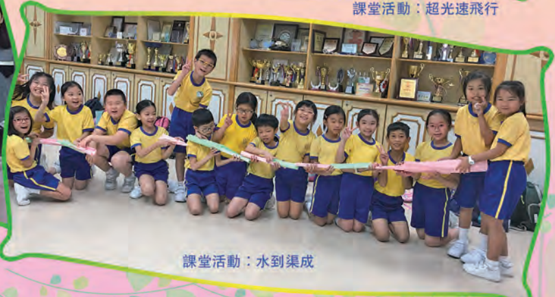
課堂活動：水到渠成