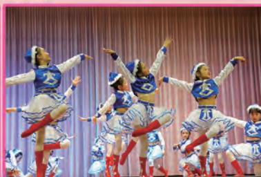
低年級中國舞表演