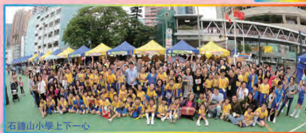
石鐘山小學上下一心