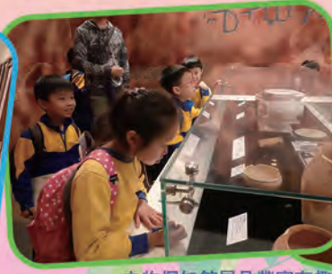
文物探知館展品豐富有趣，三年級同學都享受其中