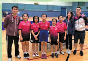
女女子乒乓球校隊