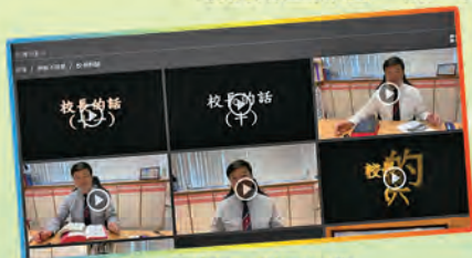
「校長的話」鼓勵同學