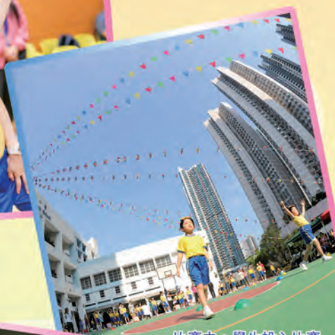
比賽中，學生投入比賽