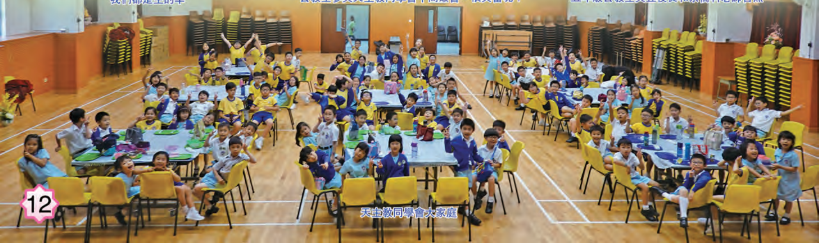
天主教同學會大家庭