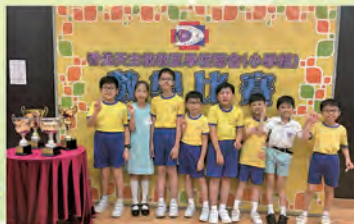
香港天主教教區會小學組比賽2