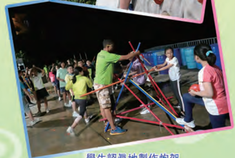
學生認真地製作炮架