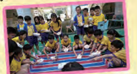
科技日活動-流水動力船

香港中文大學賽馬會氣候變化博物館主辦的「氣候變化奇幻劇場與低碳未來」，於2019年11月到校為四、五年級演出話劇，帶出減碳生活的訊息。香港海洋公園保育基金原定2020年4月到校為二、三年級主講「停止餵飼野生動物」，因疫情停課關係，改為以教學短片讓全校學生觀看。