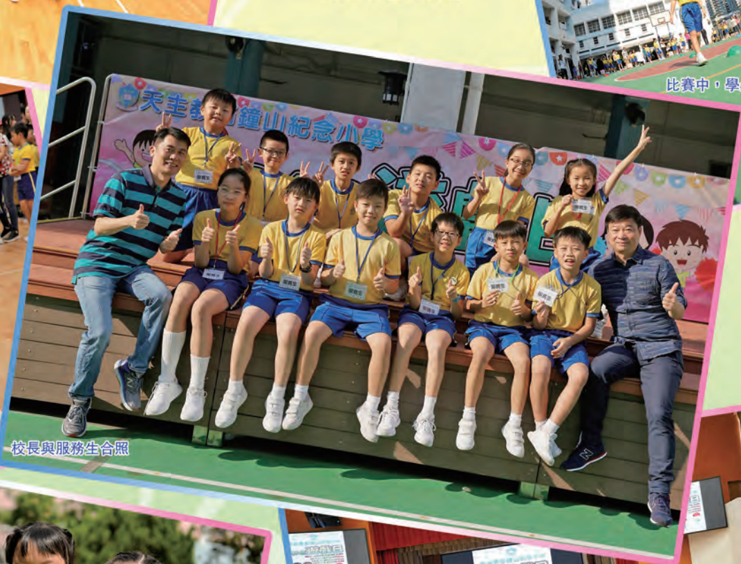
校長與服務生合照