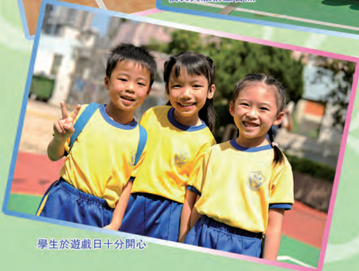
學生於遊戲日十分開心