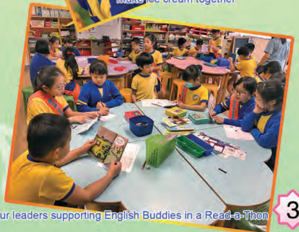
Our leaders supporting English Buddies in a Read-a-Thon