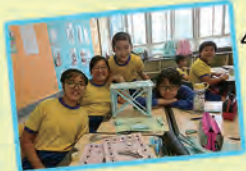
科技日活動-紙橋敵千斤

本校參加了「無冷氣日」、「綠色環保愛地球」等環保活動，支持及鼓勵學生善用資源，珍惜所有。商界環保協會賽馬會資源「智」識揀計劃於2019年10月及11月到校為四、五年級30位學生進行了兩次「綠惜大使」培訓工作坊，讓學生協助學校推廣減廢活動。香港中文大學賽馬會氣候變化博物館於2019年11月到校為30位五、六年級進行了「低碳飲食」工作坊，讓學生認識低碳飲食的知識，並鼓勵學生實踐低碳飲食生活。