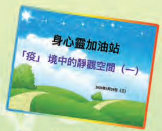
「身心靈加油站」為同學減壓