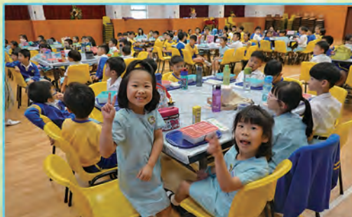
公教生參與天主教同學會午間聚會，很興奮呢！