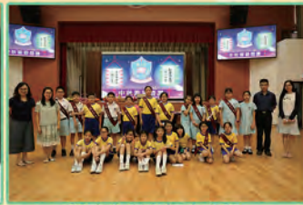
服務生與老師大合照