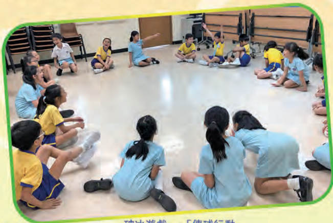
破冰遊戲 - 「傳球行動」