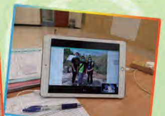
師生分享彼此的生活點滴