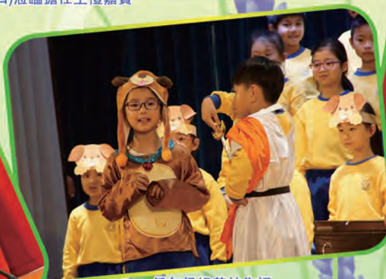
低年級組英詩集誦