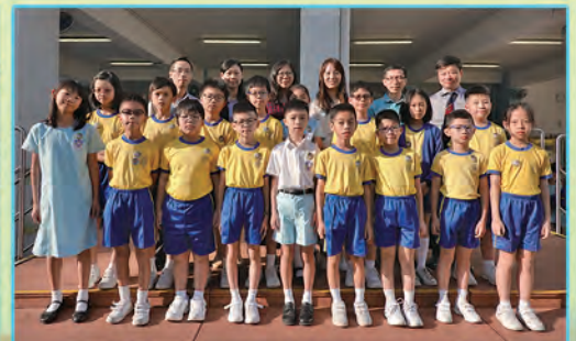
五年級公教生與丘校長和宗倫科老師合照