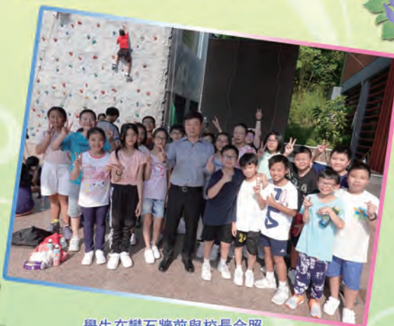
學生在攀石牆前與校長合照