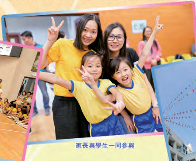
家長與學生一同參與