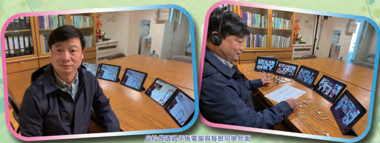
屈校長透過平板電腦與每班同學見面

願全能的天父繼續帶領我們，迎向未來的種種挑戰。感謝法團校董會一直以來的領導與鼓勵，以及老師、學生們的不斷努力和家長的鼎力支持，讓全校上下一心、團結一致、勇往直前。主佑大家！