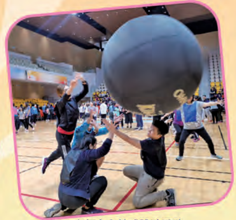
老師參與健球體驗活動