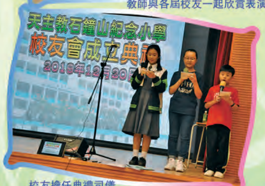
校友擔任典禮司儀