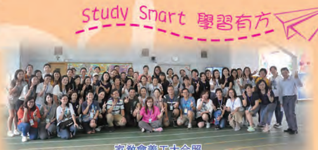
家教會義工大合照

為了讓學生更好地感受中秋節的節日氣氛和體驗中國傳統文化，本校分別於9月11日舉辦了「彩燈高掛慶中秋」和9月13日舉辦了「師生齊詠賀中秋」的活動。