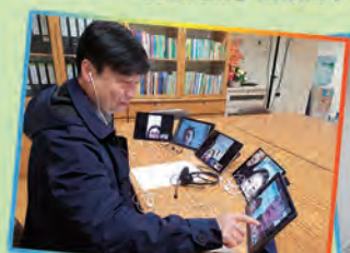
校長使用Zoom與同學打招呼