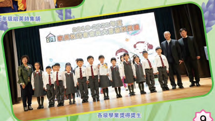
各級學業獎得獎生