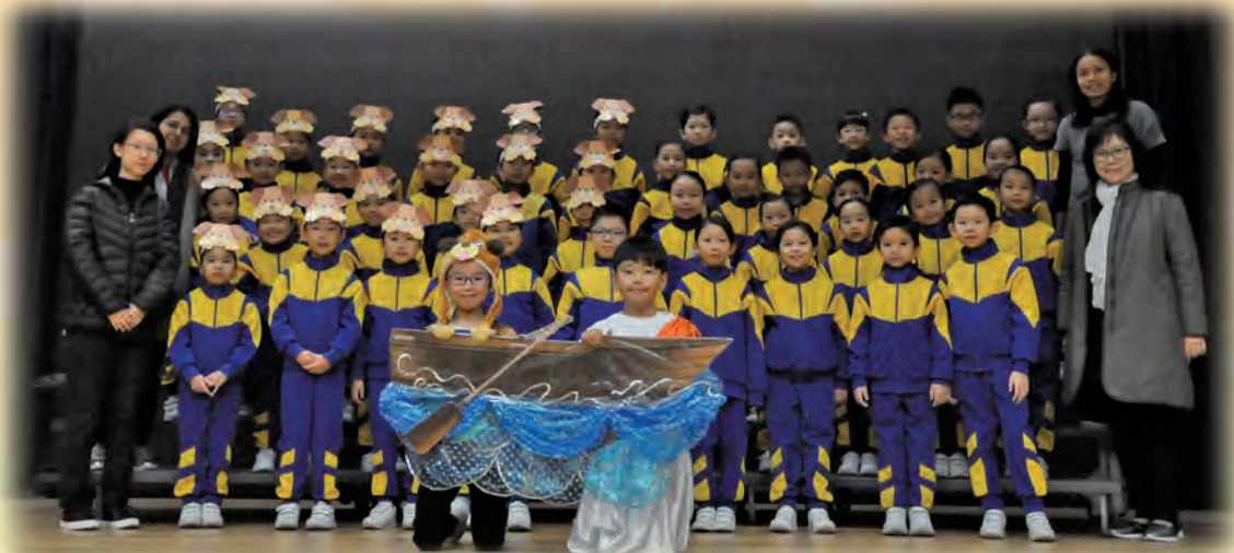
The lower primary English choral speaking team

Finally, it would have been impossible to achieve the same results without the help of parent volunteers. They made props and costumes from scratch to match the poem. Their hard work shone through the lovely props which aided in providing colourful visuals.