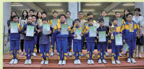
全港小學數學挑戰賽(初賽)