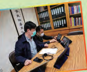
校長使用Zoom會見同學