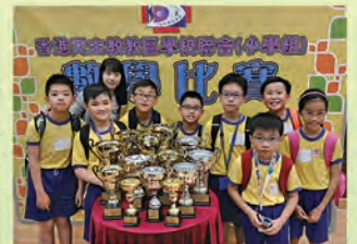
香港天主教教區會小學組比賽1