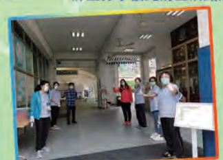
學生回校領取功課