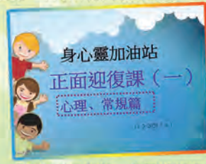
「身心靈加油站」為同學打氣