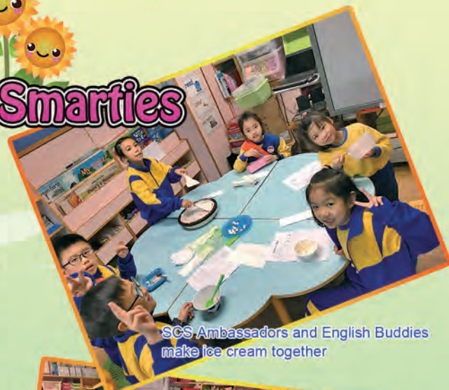
SCS Ambassadors and English Buddies make ice cream together

Our student leaders together with the support of our parent volunteers have contributed greatly to the Language Rich Learning Environment of our school.