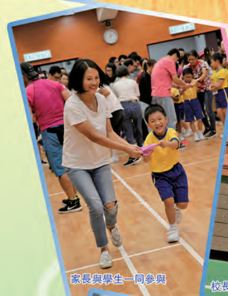
家長與學生一同參與