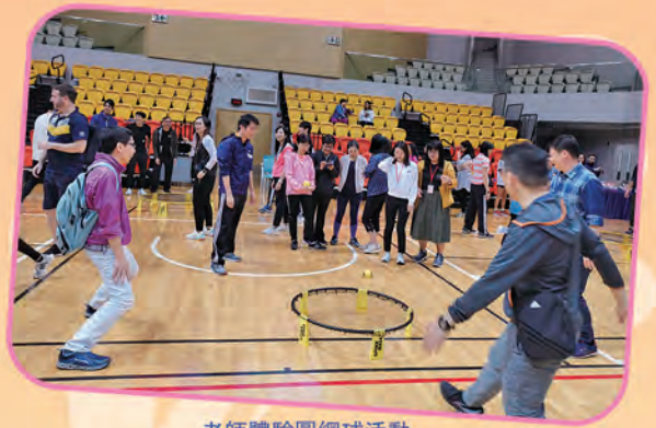
老師體驗圓網球活動

本校於二零一九年十一月十一日參與了荃灣區小學聯校教師專業發展日，是次活動打破以往的傳統，因為所有老師都可參與不同的體能活動，例如：千人操、地壺球、圓網球、躲避盤、瑜伽體驗等。大會更邀請了香港精英運動員協會主席陳念慈女士作為主禮嘉賓，她除了介紹「動感校園計劃」外，亦為老師作羽毛球示範表演，內容豐富精彩。大會更設立「活力之星」獎項，本校有兩位老師獲得此獎項，可見本校老師有良好的體能與魄力呢！