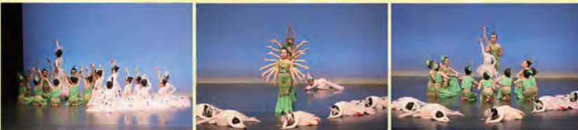
中國舞白色生靈，舞校隊榮獲校際舞蹈節甲級獎。