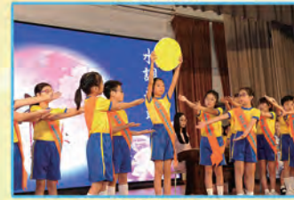
兩文三語詠唱水調歌頭