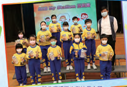
部分得獎學生與校長合照