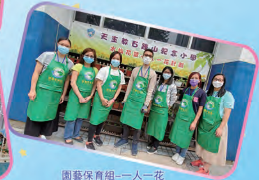
園藝保育組-一人一花