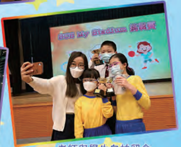
老師與學生自拍留念