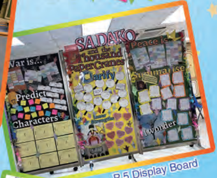
P.5 Display Board