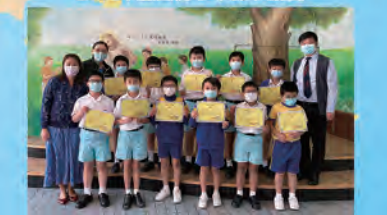
華夏盃全國數學奧林匹克邀請賽2020(香港賽區)