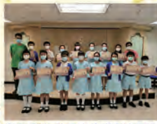
漫步西遊-資優寫作班得獎同學