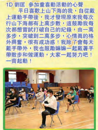
校長老師們一起參加童喜動教師運動班

我可以每天和媽媽一起到公園跑步，我感到十分開心。還有，當我做完功課後，我會做伸展運動，這讓我立刻感到精神百倍！有了運動手帶，我和媽媽都能了解自己每天的運動量是否足夠，從而鼓勵我們每天做適量運動的習慣，多做運動能使我們的身體變得強壯。