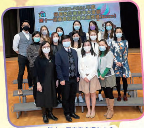
第十一屆家教會週年大會

回顧一年家校合作的活動：家長也敬師活動、家教會周年大會暨頒獎禮(ZOOM)、多場的家長講座(實體)、愛心送暖行動、家長校董選舉等，期望日後在天主的帶領下，家校繼續緊密合作，為學生們提供優質的教育，為社會培育優秀的棟樑。