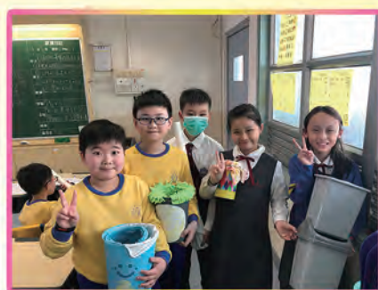
四年級：下雨天好幫手