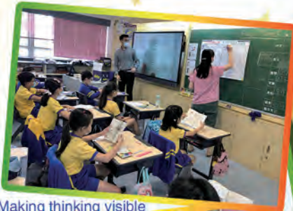
Making thinking visible

English Corner is a fun out of the classroom learning activity for our primary one to three students held during their recess time. Some examples of activities in the English Corner includes chit-chat, vocabulary and board games, tongue twisters along with other LRLE activities organized by our NETs. This provides our students an authentic practice and immerse themselves into using English as a second or third language.