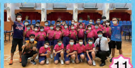
乒乓球隊隊員大合照