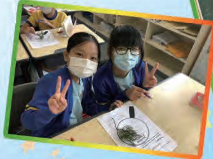
Making predictions about the story