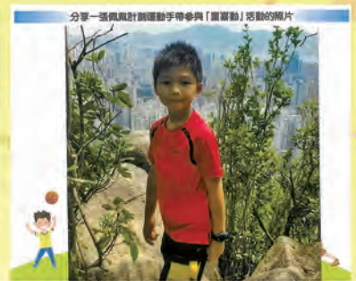
分享一張與設計運動手帶參與「童喜動」活動的照片