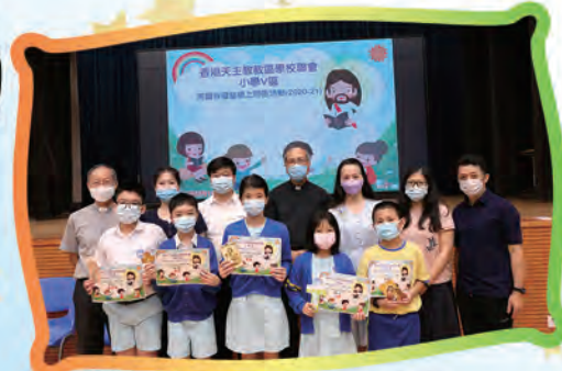
石鐘山的學生代表表現不俗呢！

為鼓勵學生多閱讀聖經，香港天主教教區學校聯會小學V區舉行了「馬爾谷福音網上問答活動」。活動於6月12日順利舉行，是次活動共有12所學校派出學生代表參與，更邀請了天主教香港教區夏志誠輔理主教擔任活動嘉賓。參加活動的同學都表示透過網上問答遊戲加深了對福音的認識，也提升了他們閱讀聖經的興趣。