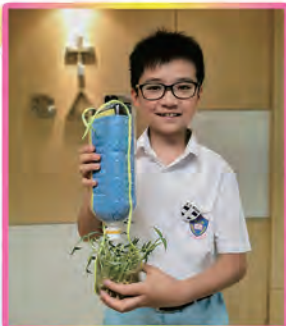
充滿創意的自動除水器