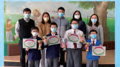
2020年荃葵青小學數學競賽