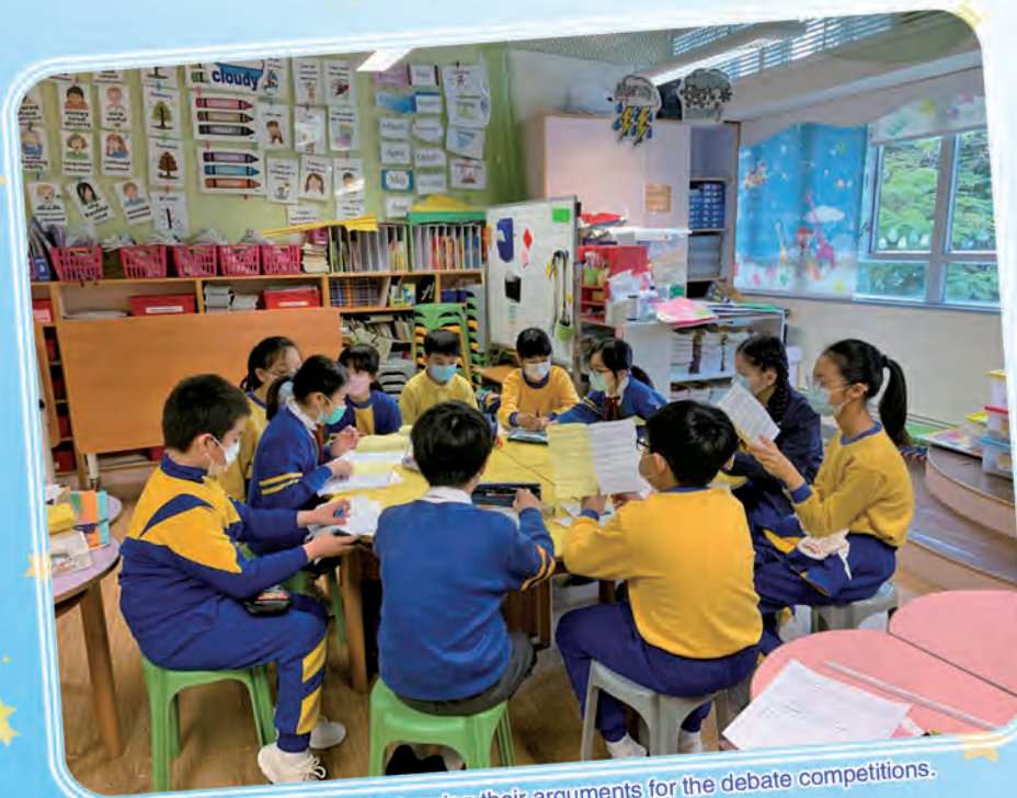
Our debaters brainstorming their arguments for the debate competitions.