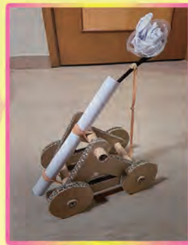
二年級自製玩具—威力無窮