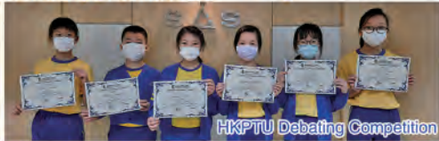
HKPTU Debating Competition