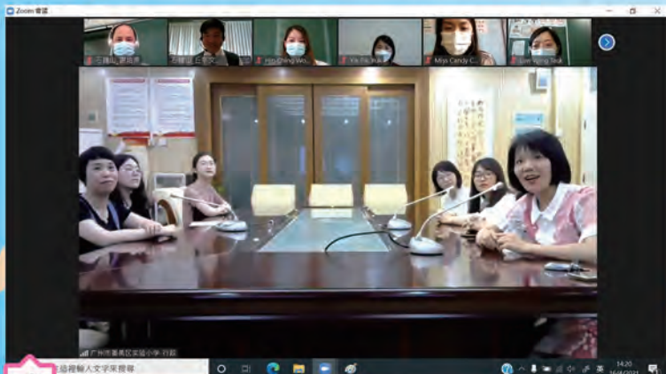
和廣州市番禺區實驗小學校長主任們網上交流