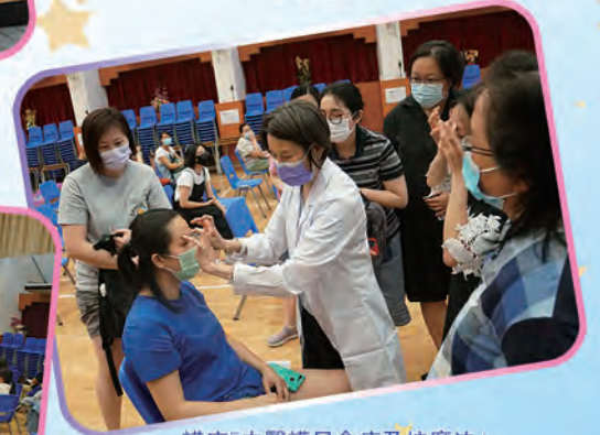
講座「中醫護目食療及按摩法」