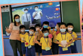
彩燈高掛賀中秋-水果大抽獎