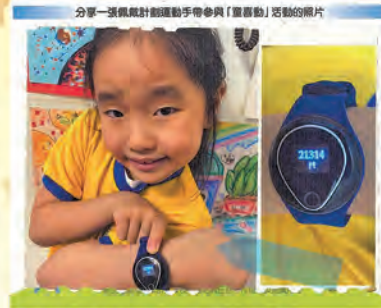
1E 許芯樂 參加童喜動活動的心聲

我可以每天和媽媽一起到公園跑步，我感到十分開心。還有，當我做完功課後，我會做伸展運動，這讓我立刻感到精神百倍！有了運動手帶，我和媽媽都能了解自己每天的運動量是否足夠，從而鼓勵我們每天做適量運動的習慣，多做運動能使我們的身體變得強壯。