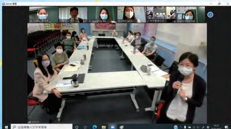
和香港仔聖伯多祿天主教小學校長、主任們網上會面