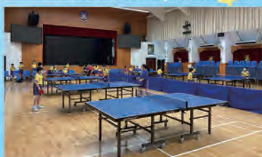
乒乓球隊校內比賽