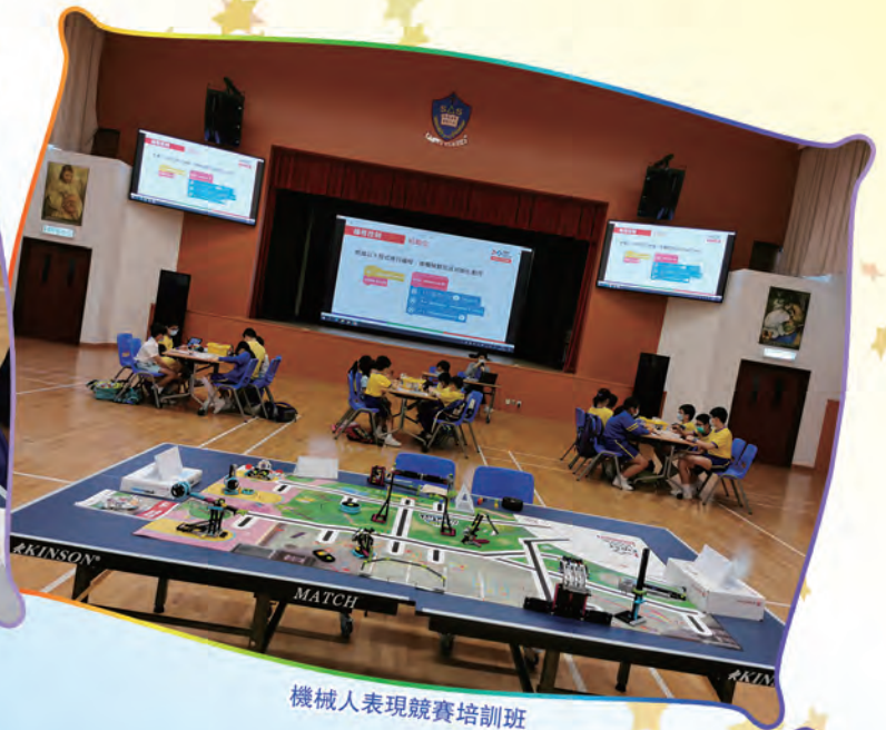
機械人表現競賽培訓班