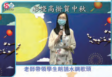
老師帶領學生朗誦水調歌頭