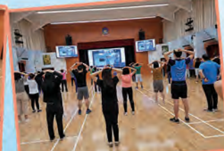
賽馬會家童喜動，老師齊齊做運動