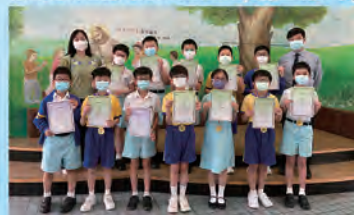
全港小學數學挑戰賽(新界南區)決賽