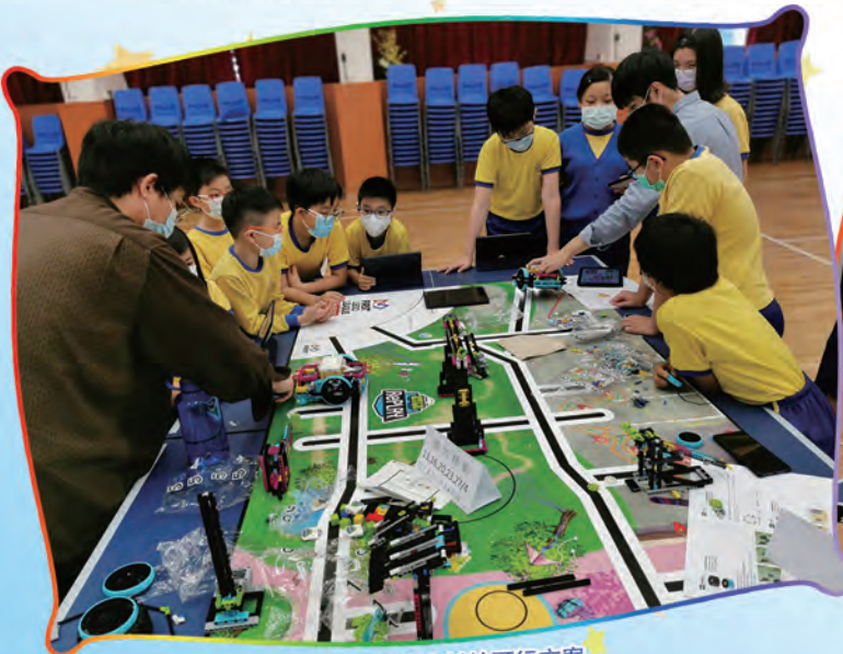
導師帶領學生討論可行方案

在場景地圖上，運用LEGO Education SPIKE Prime 創作模型以展示獨特的解決方案，並制定策略完成一系列的機械人任務。