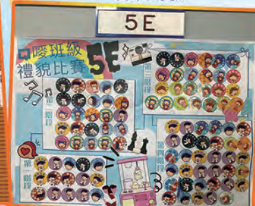
各班分階段集齊100張禮貌貼紙