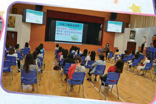
講座「網絡世界與親子溝通」