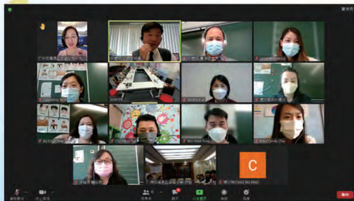
本校校長帶領全校主任和姊妹學校會議交流

將來如果疫情有所緩和，學生們能回校上課，亦會嘗試讓學生透過zoom meeting進行學術和文化交流。