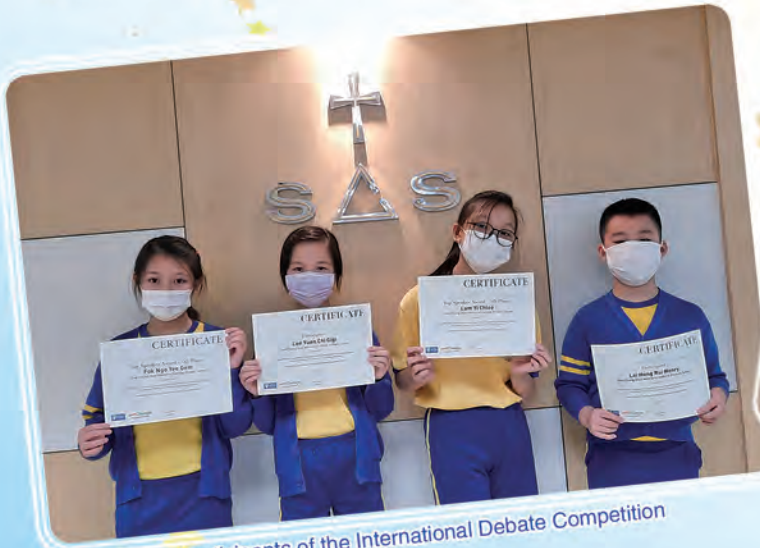
Participants of the International Debate Competition

Great effort from all the members of our English Debating Team!