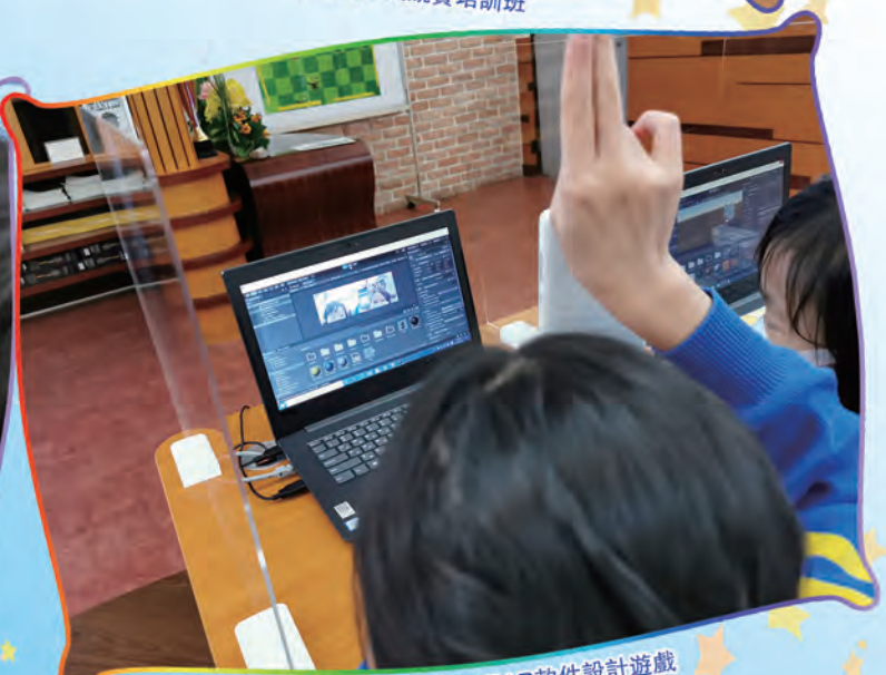
學生行用AR軟件設計遊戲