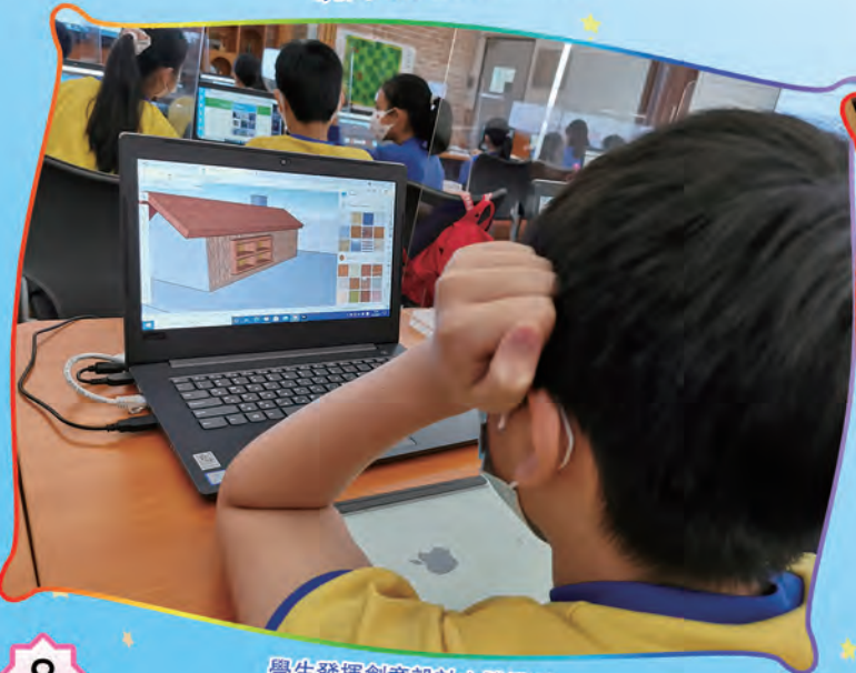
學生發揮創意設計立體模型