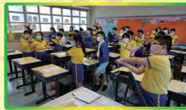
童喜動千萬步虛擬旅程步行活動

本校積極推動「賽馬會家童喜動」計劃。在老師方面，全體老師在禮堂參與了兩次教師網上運動班。在學生方面，學生參與了兩次「一童喜動千萬步虛擬步行旅程」活動、「在家ZOOM童喜動趣味活動班」、「童喜動十項全能任務」、「童喜動基礎動作技能測試日」等。在家長方面，本校鼓勵家長和學生一同參加網上聯校親子同樂日及「童喜動家長工作坊」，各項活動參與率高。本校鼓勵家長和學生每天佩戴運動手帶，計算每天步數，培養做運動的習慣。