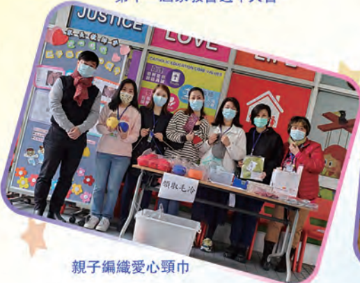
親子編織愛心頸巾