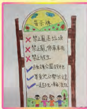
一年級—護園兵團佳作