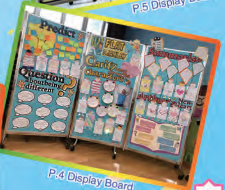
P.4 Display Board