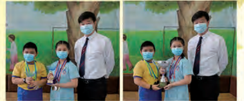
2021 第廿一屆全港校際標準舞及拉丁舞大賽小學校際組全場總冠軍 2021 第廿一屆全港校際標準舞及拉丁舞大賽小學校際雙人 森巴 (S) 冠軍