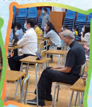
夏主教也投入參與問答遊戲