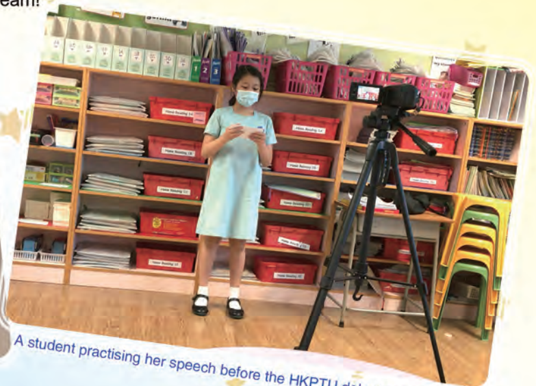
A student practising her speech before the HKPTU debating competition