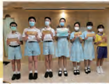
道地小學生徵文比賽得獎同學