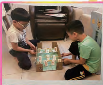
十分好玩的足球機

各級優化了專題研習的內容，運用STEM元素順利完成了專題研習，各級主題分別為：一年級「護園兵團」、二年級「自製玩具」、三年級「消暑大法」、四年級「下雨天好幫手」、五年級「立體影像投射器」及六年級「可再生能源」。