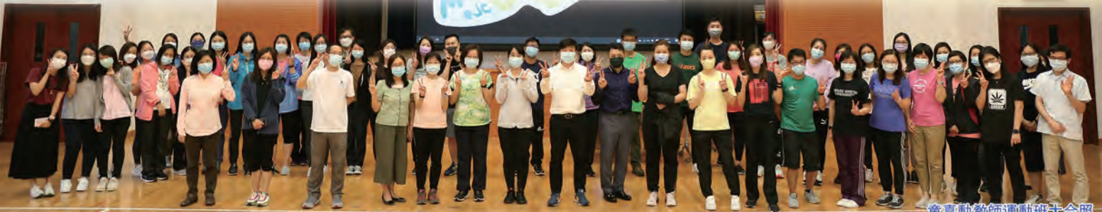
童喜動教師運動班大合照